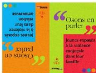
Livret "Osons en parler"