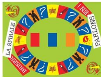
Jeu "Briser la spirale"

de faire de la prévention en matière de violences sexistes et conjugales de manière ludique et interactive.