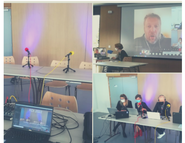
Le plateau technique