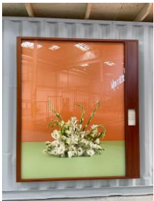
Rosa X hybrida, Rose de thé, Kenya Cymbidium hybride, Orchidée Cymbidium, Pays-Bas Rosa X hybrida, Rose de thé, Equateur Chrysanthemum, Chrysanthème (INTERDIT)

du prix que la Chine était prête à payer pour le gaz naturel. La Chine avait déjà obtenu des contrats de fourniture avantageux en Asie centrale et était donc en mesure de faire pression sur la Russie. L'accord final garantissait la vente de plus d'un billion de mètres cubes de gaz naturel sur 30 ans, pour un montant estimé en valeur marchande à quelque 400 milliards de dollars. Le prix réel négocié n'a pas été publié.