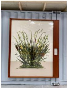
Groupe Gladiolus Grandiflorus, Glaïeul, Portugal

Les dommages causés par la guerre aux infrastructures civiles du Liban ont entraîné la destruction de son service postal national. De nombreuses rues sont sans nom, et les maisons et les bâtiments n'avaient pas d'adresses codifiées. Les citoyens libanais devaient adresser leurs lettres de manière descriptive : à la maison « en face de la pharmacie » ou à l'appartement « au troisième étage de l'immeuble blanc en face du fleuriste ». Après avoir examiné plusieurs propositions internationales, le Liban a attribué le contrat pour la reconstruction de sa poste à deux sociétés canadiennes de de gestion postale. En 1998, l'entreprise conjointe canado-libanaise Libanpost a commencé à développer et à exploiter le service postal. En deux ans, une nouvelle méthode de tri et de distribution, un code postal a été attribué à chaque bâtiment du pays, le volume du courrier a quadruplé et la quasi-totalité des lettres arrivent à destination dans les vingt-quatre heures.