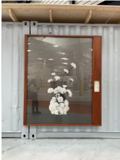
Anthurium andreanum, Anthurium, Pays-Bas Dendrobium hybride, Orchidée Dendrobium, Thaïlande X Mokara, Orchidée Mokara, Venezuela Rosa X hybrida, Rose de thé, Kenya