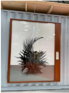
Groupe Gladiolus Grandiflorus, Glaïeul, Portugal