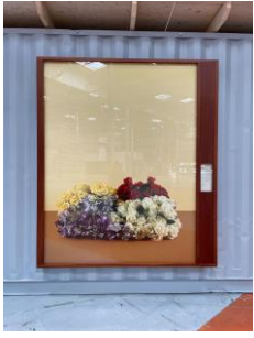
Dianthus caryophyllus, Œillet, Colombie