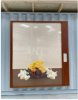
Groupe Gladiolus Grandiflorus, Glaïeul, Portugal