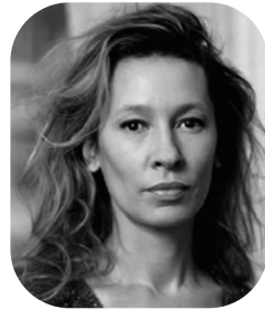
Emmanuelle BERCOT PRÉSIDENTE DU JURY 2023 MARRAINE 2024