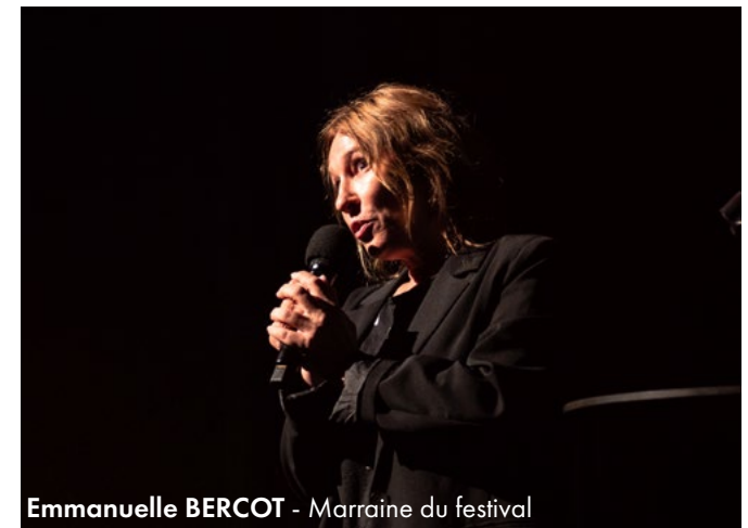
Emmanuelle BERCOT - Marraine du festival