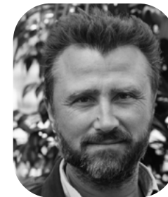
Alexandre BRASSEUR acteur