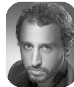
Arié ELMALEH acteur