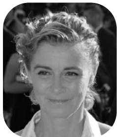
Anne CONSIGNY actrice