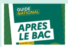
Après le bac