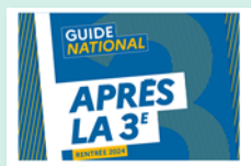
Après la 3e