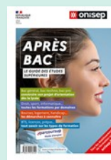
APRÈS-BAC, le guide des études supérieures

Retrouvez-nous sur le site internet de l'académie :